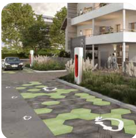
Stationnement de recharge électrique